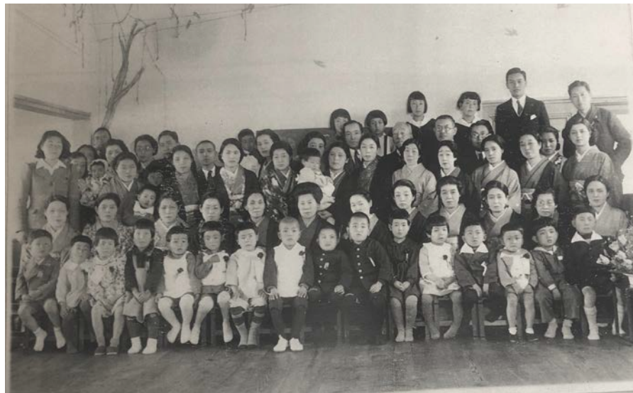
1941年 第1回入園式の様子

〒951-8116 新潟市中央区東中通1-86 みどり幼稚園 事務室内 みどりサポーターズクラブ TEL 025-201-6664 FAX 025-201-8668