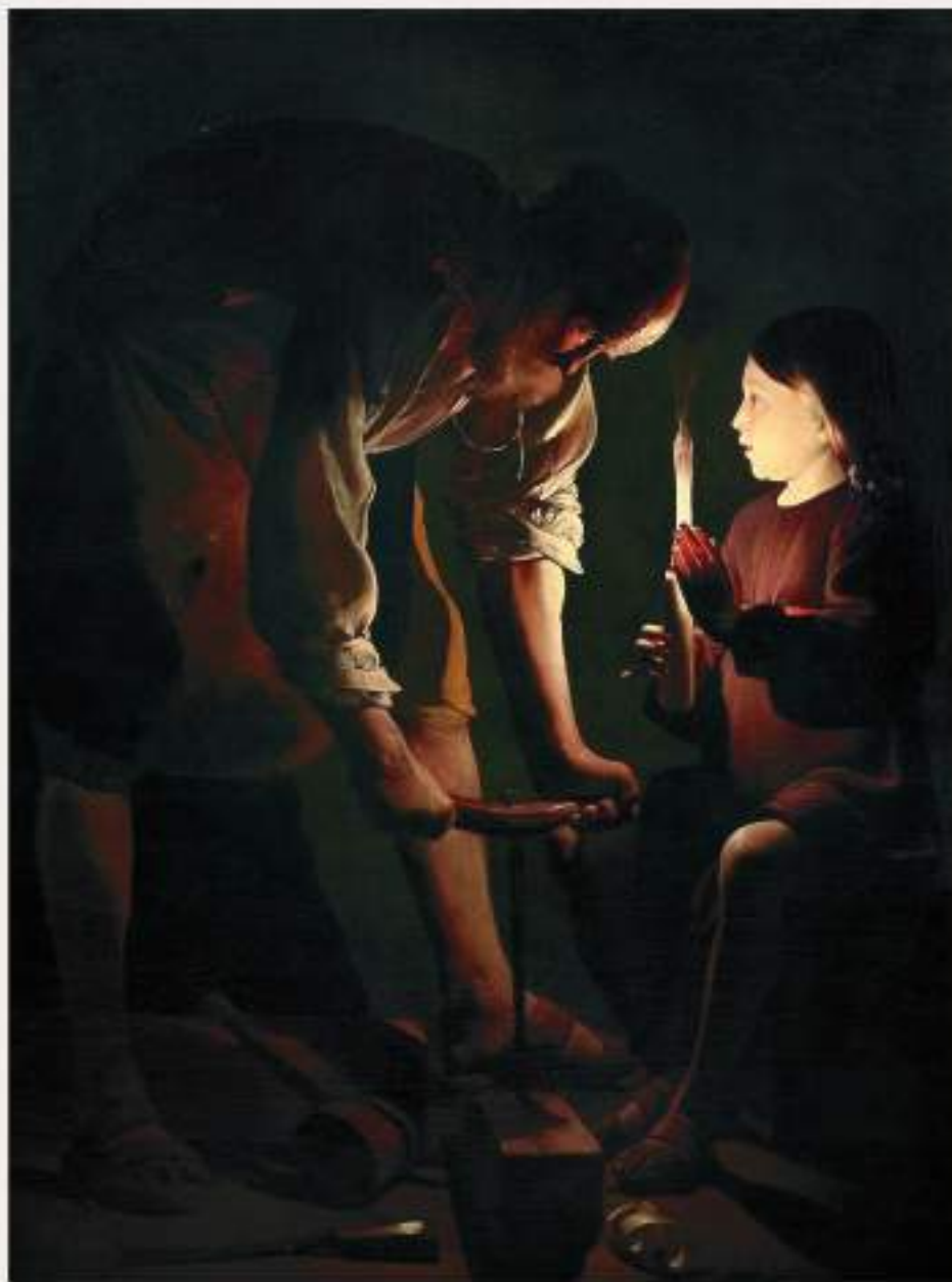
SAINT JOSEPH CHARPENTIER GEORGES DE LA TOUR

GEORGES DE LA TOUR, CC BY-SA 4.0, VIA WIKIMEDIA COMMONS