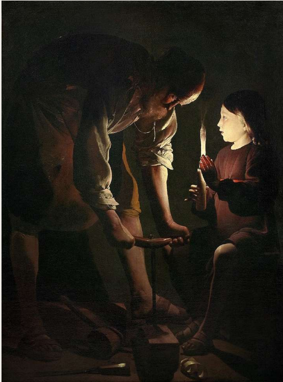
SAINT JOSEPH CHARPENTIER GEORGES DE LA TOUR

GEORGES DE LA TOUR, CC BY-SA 4.0, VIA WIKIMEDIA COMMONS