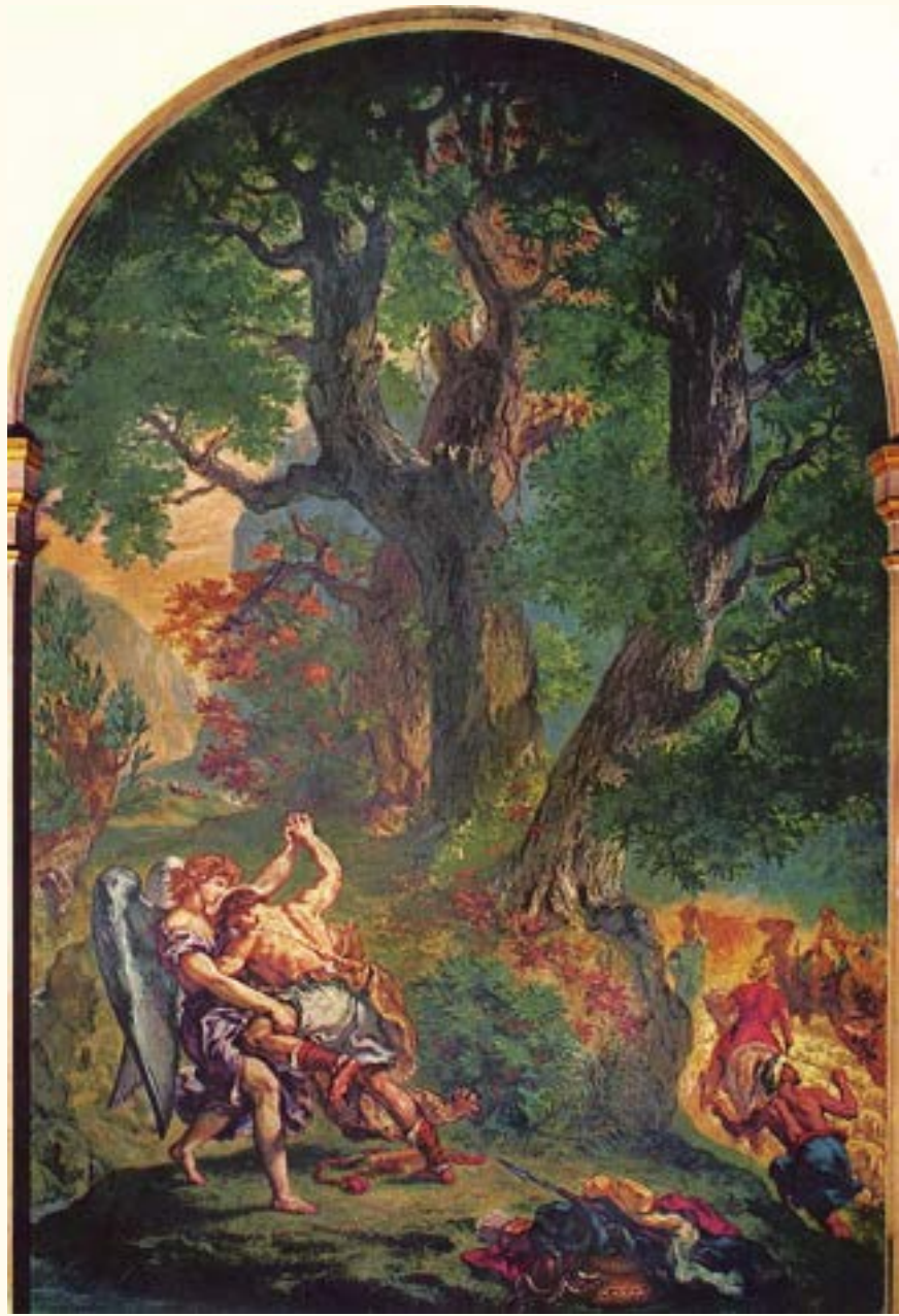
PAINTINGS BY DELACROIX IN SAINT-SULPICE PUBLIC DOMAIN

JACOB WRESTLING WITH THE ANGEL EUGÈNE DELACROIX