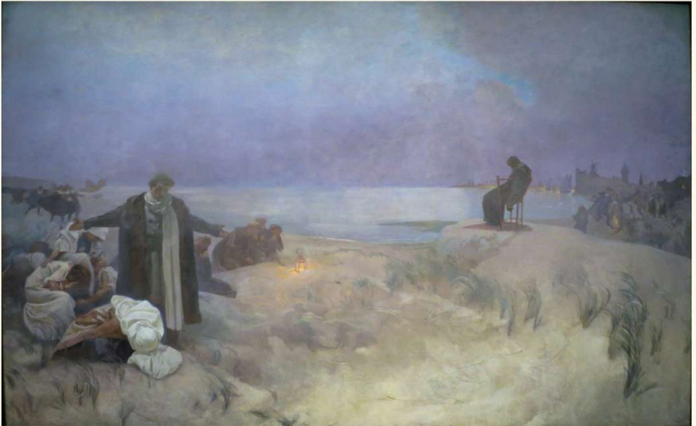
MUCHA'S THE SLAV EPIC CYCLE NO.16: JAN AMOS KOMENSKÝ: A FLICKER OF HOPE (1918) PUBLIC DOMAIN

ALFONS MUCHA THE LAST DAYS OF JAN AMOS KOMENSKÝ IN NAARDEN