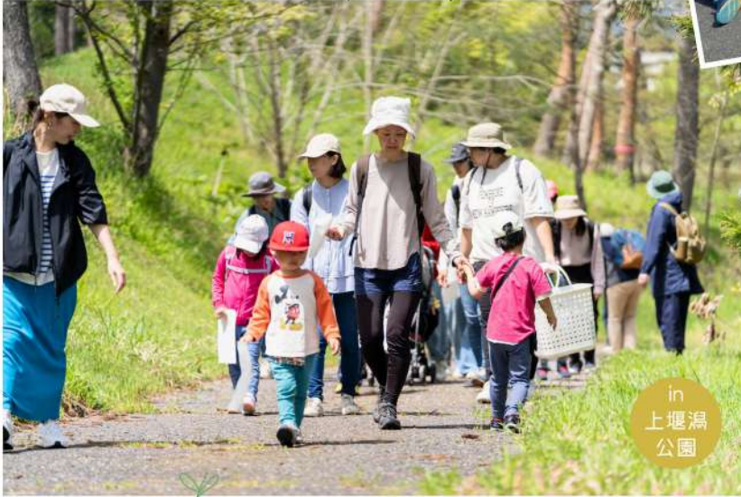
in 上堰湯 公園