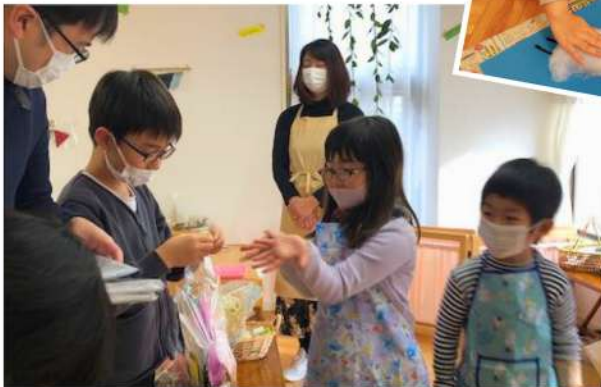
いらっしゃいませ! お店やさんに ようこそ!