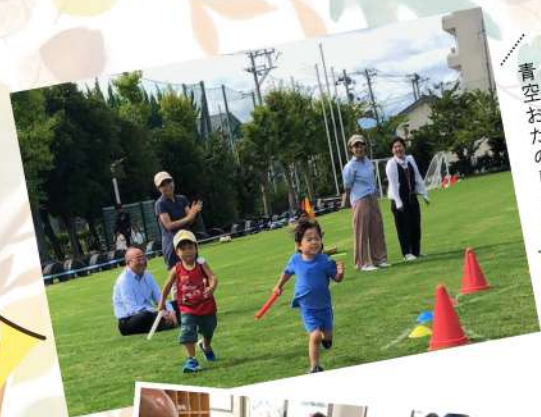
広いグラウンドで 青空おたのしみ会!