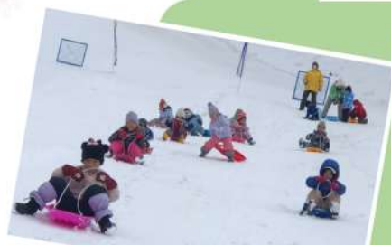
ソリ遊びにも 行きますよ~!