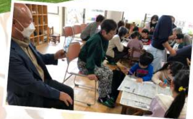
in りゅーと ぴあ