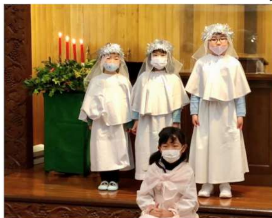
クリスマス礼拝での 生誕劇だよ