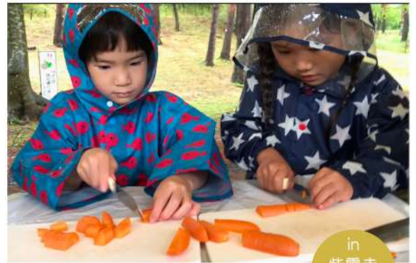
in 紫雲寺 記念公園